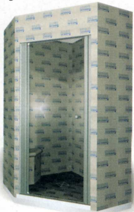
Hartschaum-Trägerelemente bilden die Basis für die Lux-Dampfduschkabine.

Das Programm Relax hat Lux Elements für den privaten Wellness-Bereich entwickelt.