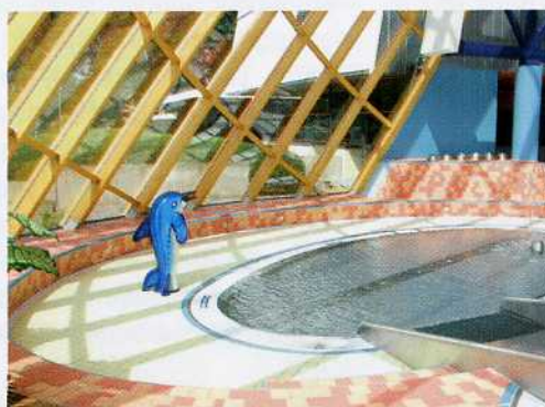
Durch die Diagonal- und Rundverlegung der Fliesen und deren harmonische Farbigeit entsteht eine lebendige heitere Atmosphäre