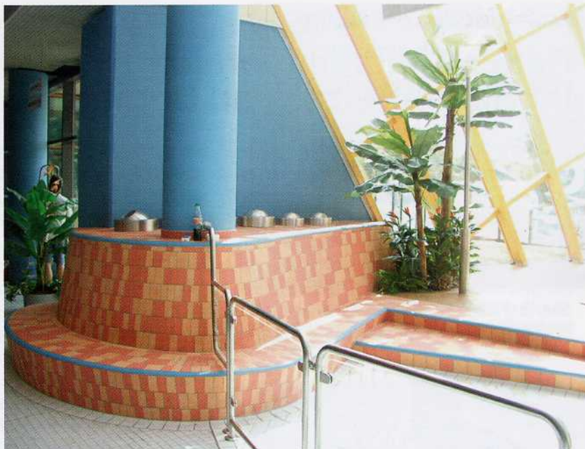
Runde und geschwungene Formen entstehen als maßgeschneiderte Sonderlösungen für individuelle Objekte

Optisch wurde das mediterrane Flair durch die von der Grosche GmbH, Olsberg durchgeführte Verfliesen vervollständigt. Gelbe