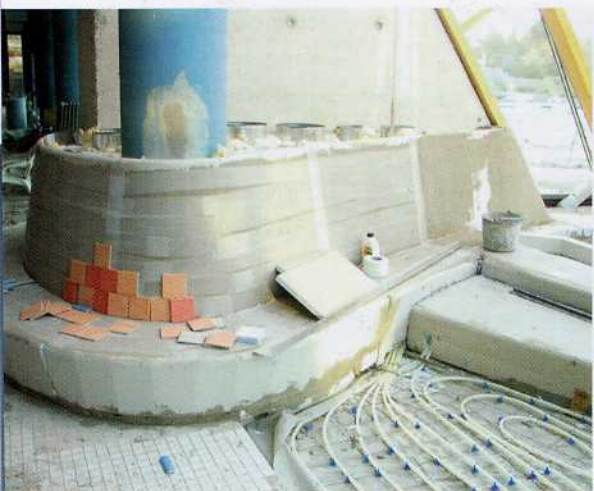
Aus werkseitig vorgefertigten Trägerelementen entsteht der neue Kleinkindbereich

wurden noch während der Bauphase viele Abstimmungen aufgrund des guten funktionierenden CAD-Datenaustausches über dxf-Format schnell und flexibel verarbeitet. Alle Hartschaum-Trägerelemente wurden im Werk maßgenau vorgefertigt, in den eigenen Produktionshallen aufgebaut und überprüft. Sitzbänke und Bodenaufbauten wurden bereits im Werk auf Maß über die Heizleitungen gefräst. Die Sitzflächen erhielten eine Nutfräsung für die Aufnahme von Heizrohren. Im Fußteil wurden Aussparungen für Beleuchtungskörper vorgenommen