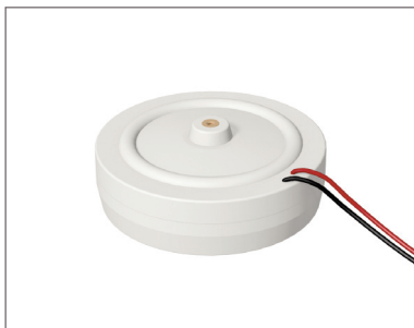
Contactgeluidomzetter ADD-/CAB-SO KSW

LUX ELEMENTS®-ADD-SO KSW (LEADD4000) / -CAB-SO KSW (LESPA1209) – contactgeluidomzetter voor de weergave van gemiddelde en hoge tonen op een trillend oppervlak zoals hardschuim, kabellengte 3 m, IP 68, incl. een stokschroef en een plaat van hard kunststof aangebracht in hardschuim ter bevestiging.